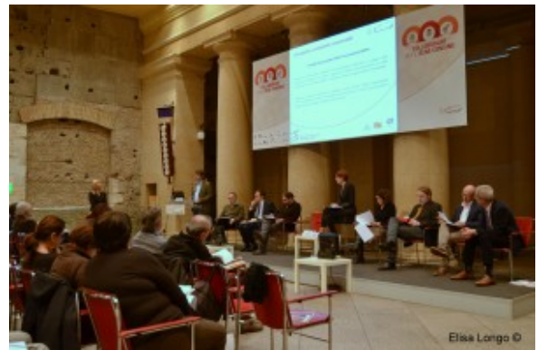
Tavola Rotonda “Collaborare per il bene Comune”

Onlus, imprese, pubbliche amministrazioni: questi i protagonisti della la conferenza tenutasi oggi alla Camera di Commercio di Roma. “Collaborare per il bene comune” non è un vuoto simulacro, uno slogan populistico e oggi testimonia il lavoro quotidiano di migliaia di operatori che producono capitali e desiderano mettersi in rete. La sala del Tempio di Adriano (foto) ha accolto stamattina una Tavola Rotonda con numerosi operatori profit, non profit e Pubblica Amministrazione, relatori e partecipanti tutti concentrati sul futuro del terzo settore, delle imprese e delle istituzioni capaci produrre valore.