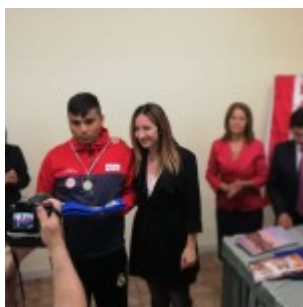
Cerimonia dei ragazzi peruviani durante Dreamworldcup 2018 di Roma