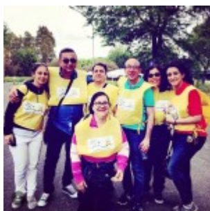
Volontari dell'associazione Itaca