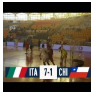
Italia Chile in campo