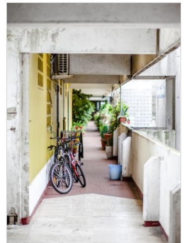
Farbe, Pflanzen, Fahrräder. Ein Hauch von Normalität.

Ihr Vater sei Architekt gewesen. Deswegen hat sie ein besonderes Verhältnis zu dem Gebäude entwickelt. Sie findet es architektonisch perfekt, gut durchlüftet und durch die offene Anlage der Treppenhäuser und Laubengänge besser einsehbar und damit weniger gefährlich als manch geschlossenes Mehrfamilienhaus. Sie begeistert sich auch für die Lage: „Wir sind in 20 Minuten in der Stadt und in der gleichen Zeit am Meer“. Man könne morgens schon auf die Felder gehen und Spargel stechen oder Spaziergänge in den nahen Naturschutzgebieten machen. Und die Kinder? Die Mutter ist überzeugt, dass ihre beiden Kinder im Viertel sehr gute Schulen besuchen und dass die Stadt mächtig in deren Qualität – auch zur Integration und zur Förderung von Kindern aus Problemfamilien – investiert hat.