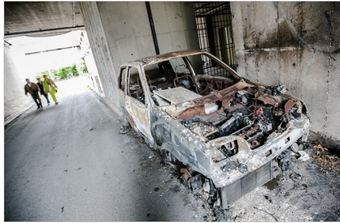
Vermieter, Stadt und Polizei wissen von den Autowracks. Doch niemand holt sie ab.

Doch Schuld an der Misere ist nicht allein der Vandalismus. Das Hauptproblem sieht mancher Mieter in der Gleichgültigkeit der Eigentümergesellschaft Ater, in Vetternwirtschaft und Ämtergeschacher. Eigentlich war Ater 2002 nach einer Neustrukturierung der Wohnungsbaugesellschaft I.A.C.P. als privatrechtlich verwaltete Körperschaft öffentlichen Rechts gegründet worden, um sie so vom schwerfälligen bürokratischen Verwaltungsapparat der öffentlichen Hand abzukoppeln. Sie sollte flexibler auf den Markt reagieren können.