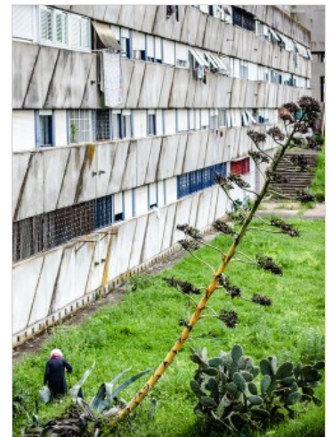
Die meisten Mieter zahlen sehr wenig Miete. Viele von ihnen wollen deshalb nicht weg, selbst wenn ihre Wohnberechtigung nicht mehr gilt.