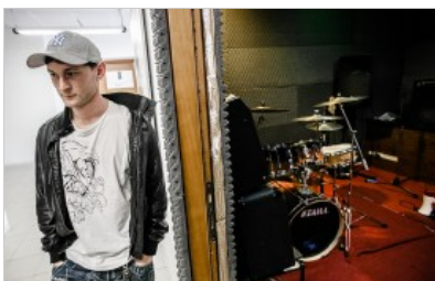
Die Band Grimlock produziert Hip-Hop-Musik im Corviale.

Der Architekt soll sich aus Gram umgebracht haben