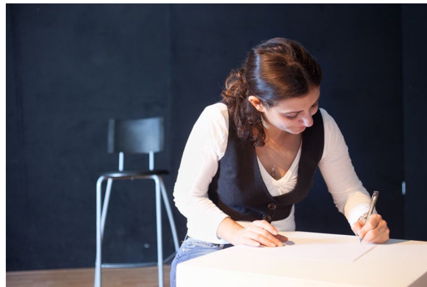
FASE 2 - IL SOGGETTO DEL RITRATTO SCRIVE UN TESTO SU DI SÉ