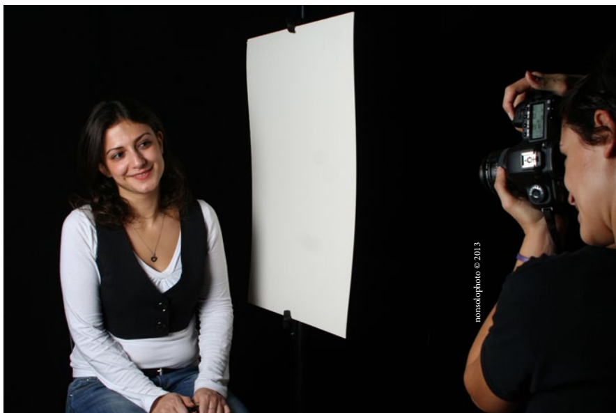
FASE 1 - RITRATTO FOTOGRAFICO