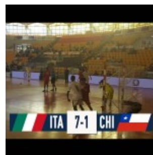
Italia Chile in campo